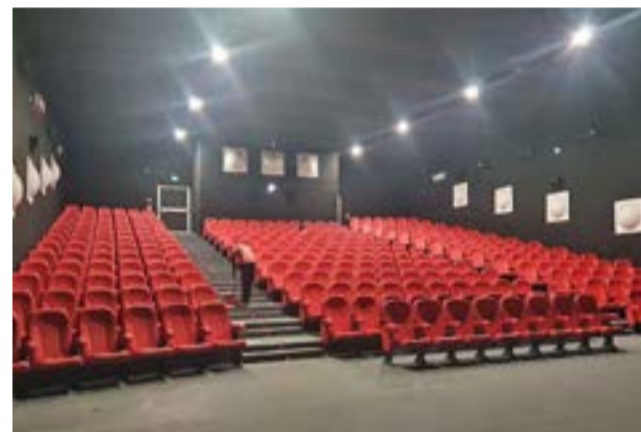
L'intérieur de la salle Canal Olympia à Poto-Poto.