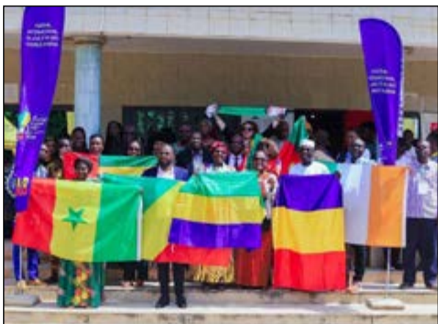
Les drapeaux de quelques pays ayant participé à la troisième édition du Filab.

Pour ma part, j'ai rappelé que le problème identitaire de certains écrivains n'est pas spécifique aux pays ouest-africains. Le cas de l'écrivaine russophone Svetlana Alexievitch, lauréate du Prix Nobel de littérature 2015, en est une parfaite illustration. Quand certains la présentaient comme une Ukrainienne, d'autres la considéraient