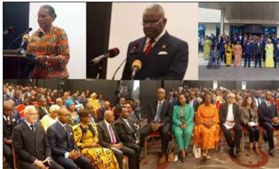
Ouverture de la session du Conseil économique, social et environnemental 2025