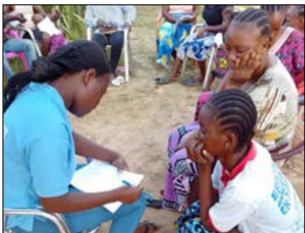
Au Quartier 4, à Owando (Fédération RC de la Cuvette)

jeunes et aînés, discuter avec eux, et surtout les convaincre d'aller voter pour notre candidat. Le contexte présent est difficile, c'est vrai. Mais, nous devons fortement nous impliquer, pour peser de tout notre poids, afin que notre candidat soit élu, et obtenir, en contrepartie, des garanties d'une meilleure gouvernance dans le mandat à venir, dans l'objectif d'améliorer les conditions de vie des populations». Depuis, les fédérations du R.c envoient leurs équipes sur le terrain, pour enregistrer les nouveaux militants et passer les consignes, comme on peut le voir sur les images suivantes.