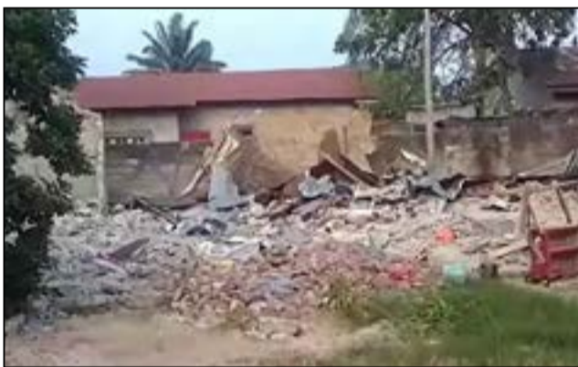
Maison détruite par la D.g.s.p à Talangai

L'opération de lutte contre les bandits dits bébés noirs et kulunas se poursuit avec la D.g.s.p (Direction générale de la sécurité présidentielle). Les forces de police et de gendarmerie sont également montées au créneau, depuis que le Président de la République, Denis Sassou-Nguesso, a déclaré avoir ordonné lui-même à la D.g.s.p de mener cette opération, aux côtés des autres forces de sécurité. Depuis la semaine dernière, les éléments de la D.g.s.p ont déclenché l'opération à Pointe-Noire où l'on compte déjà des morts et des destructions de maisons.