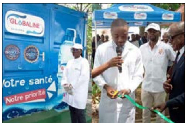
L'inauguration du point de vente d'eau Globaline au C.h.u

Entreprise ayant pour vocation la production et le conditionnement de l'eau