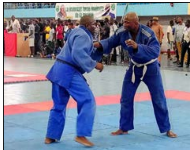
Lors des entraînements

64 judokas des Diabes-Rouges, la sélection nationale, sont en chantier depuis plus d'un mois au Complexe sportif de Kintélé, sous la supervision de la Fécoju-Da (Fédération congolaise de judo et disciplines associées), pour préparer trois compétitions africaines majeures qui vont se dérouler dans un proche avenir, à savoir: