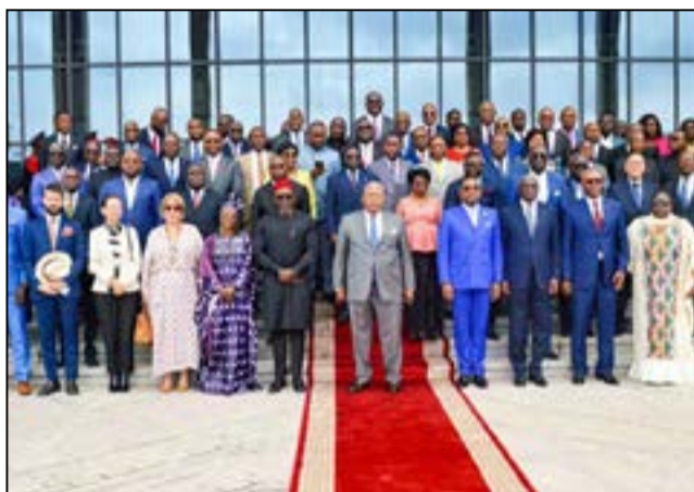
Photo de famille après l'ouverture de la journée parlementaire sur le P.a.d.c.

Selon le président de l'assemblée nationale, le P.n.u.d a offert à son institution, «l'occasion d'un échange interactif et fructueux sur le Programme accéléré de développement communautaire, P.a.d.c en sigle, prévu d'être exécuté au cours de la période 2026-2030». A travers ce programme, «il s'agit de rendre opérationnelle une idée simple et puissante qui consiste à mettre en place une approche territorialisée de développement stratégique et cohérent, afin d'éradiquer la pauvreté. Eradiquer la pauvreté passe inéluctablement par la réduction des inégalités territoriales, le renforcement de la cohésion sociale et l'amélioration durable des conditions de vie des populations». «Pour notre pays, réaliser le P.a.d.c ne serait pas faire un saut vers l'inconnu, d'autant plus qu'il a pour base un diagnostic détaillé des besoins sur les quinze départements du Congo. L'Assemblée na-