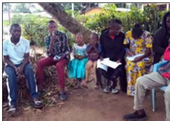
A Djambala (Fédération RC des Plateaux)