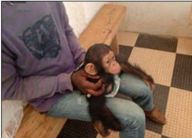
L'homme interpellé avec un bébé chimpanzé.

De son côté, le bébé chimpanzé a été confié aux soins de l'équipe de l'Institut Jane Goodall au sanctuaire de Tchimpounga, dans le Département du Kouilou. L'animal bénéficiera de soins adaptés avant une éventuelle réin-