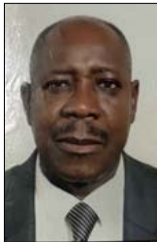
Par Guy-Roger Mankedi.

La responsabilité des autorités municipales est pleine et entière. L'histoire doit être écrite de manière collective, sous la conduite de ceux qui sont chargés de la bonne marche de la cité. Il faut former et informer les citoyens à travers des rencontres dé-