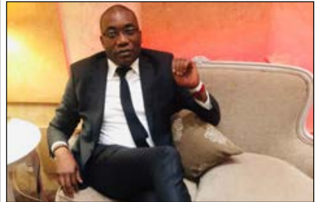
Par Charles Abel Kombo.

De la Grèce à l'Afrique, se dégage une même leçon pour la France et les pays africains francophones: un battement d'ailes à Athènes et c'est tout un système qui vacille. En effet, la crise de la dette grecque, au début des années 2010, a été bien plus qu'une tragédie nationale: elle a révélé la fragilité d'un monde financier interconnecté, où la dette d'un pays peut devenir la faille de tous. Quinze ans plus tard, la France et plusieurs pays africains vivent, à leur tour, les secousses de ce battement d'ailes initial. La dette publique, autrefois instrument de développement et de solidarité, est devenue le thermomètre de nos vulnérabilités. Et dans un monde où les taux d'intérêt, les guerres et les marchés décident du destin budgétaire des Nations, aucun État n'est à l'abri du souffle du papillon grec.