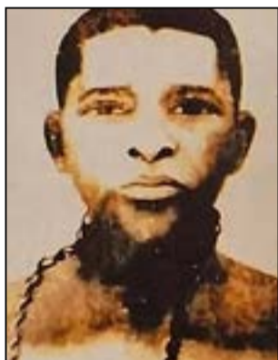
Le héros Bouéta Mbongo, de son vrai nom Malonga Mi-Mpandzou.

jeu colonial. Après la mort de Mabiála-Ma-Nganga en 1896, il prit la tête de la résistance kongo-lari contre les exactions de la colonisation (corvée, exploitation des populations, violences, brutalité des milices coloniales, etc).