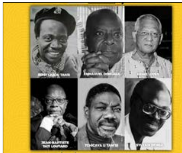
Des figures de la phratrie