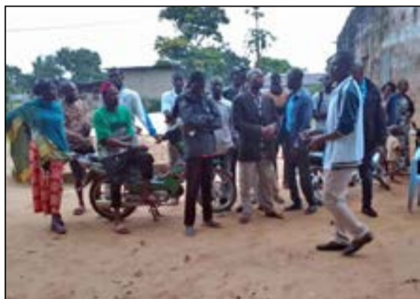
A Djambala (Fédération RC des Plateaux)