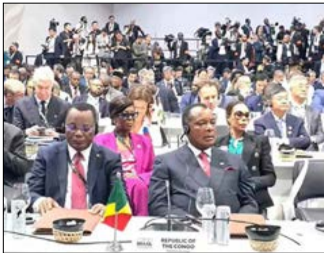
Le Président Denis Sassou-Nguesso (à droite), le ministre Jean-Claude Gakosso et la ministre Arlette Soudan Nonault (au milieu) au sommet de Belém.

«Depuis plus de quatre décennies, mon pays, la République du Congo, porte,