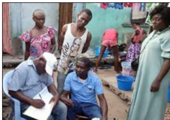
Au Quartier 24, Nimbi, à Bacongo (Fédération RC de Brazzaville)