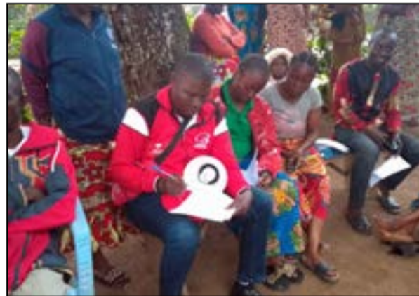
A Djambala (Fédération RC des Plateaux)