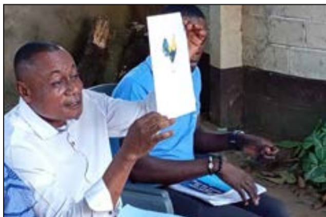
A Impfondo (Fédération RC de la Likouala)