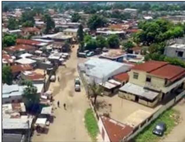
La vue d'un quartier de Bacongo

A l'évidence non! L'histoire est et a toujours été dynamique: « O tempora! O mores », disent les latins (Autres temps, autres mœurs). Notre pays a connu moult mutations aux plans politique, sociologique et historique. Les consciences ont évolué fondamentalement. Il y a une véritable prise de conscience. Les Congolais ont de plus en plus soif de reconquérir, coûte-que-coûte, leur histoire, leur identité et leur dignité, en faisant table rase du passé. Il ne saurait être question d'attiser un senti-