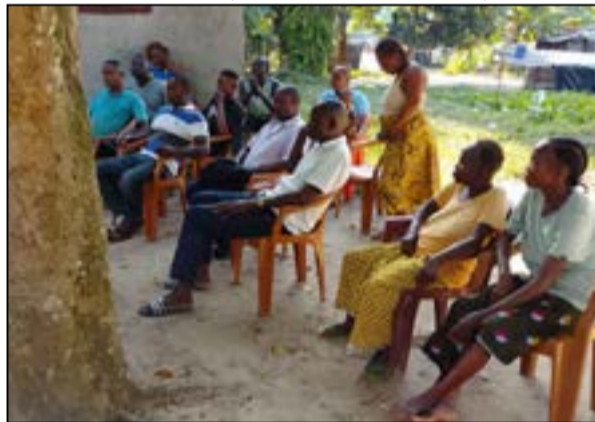
Au Quartier 6 Linengué, Owando (Fédération RC de la Cuvette).