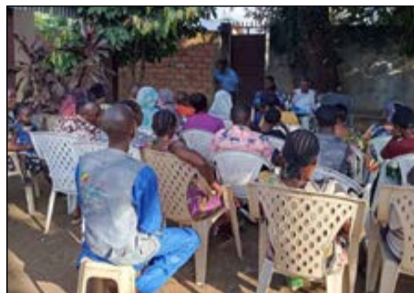
A Impfondo (Fédération RC de la Likouala)