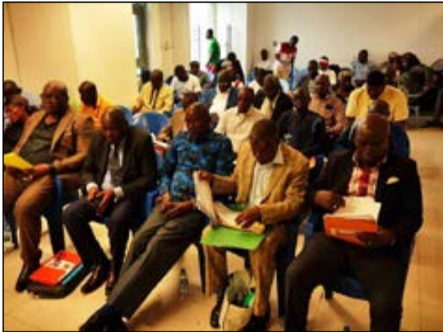
Des congressistes pendant les travaux.

de la Fécohand ont été reçus, mercredi 5 novembre, par le ministre en charge des sports, Hugues Ngouélondélé, à son cabinet de travail. Celui-ci les