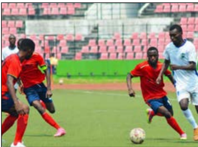
Comment sortir le football congolais de l'abîme.

stades, pour les championnats nationaux de football. Face à cette question, le Ministère en charge des sports a donné ces conditions, pour accepter de mettre les stades à la disposition des championnats nationaux. Il s'agirait principalement de trois conditions: - les arbitres doivent s'engager sur l'honneur, contre la corruption; - les clubs doivent assurer leurs joueurs; - le nombre de clubs en championnat de Ligue 1 doit être ramené de 16 à 14. A ces trois conditions, le Comité exécutif de la Fécofoot considère que les textes existent pour empêcher les arbitres de ne pas se livrer à la corruption et qu'il suffit