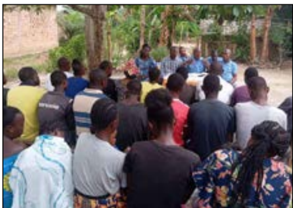
A Impfondo (Fédération RC de la Likouala)