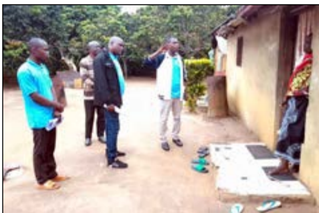
A Djambala (Fédération RC des Plateaux)