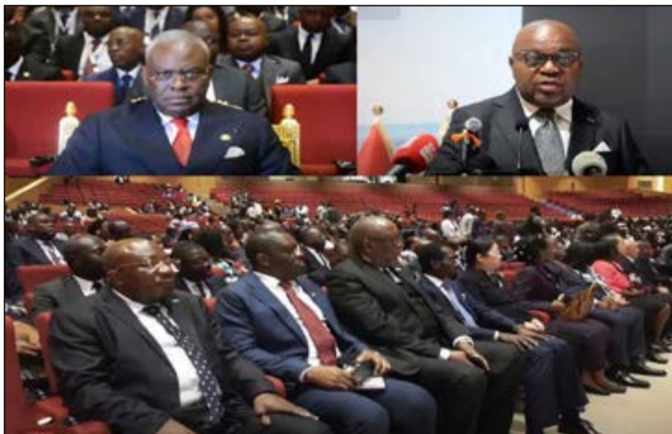
L'ouverture de la Cecla 2025

Le contenu local repose sur un principe clair: toute activité économique exercée sur le territoire national doit contribuer directement au