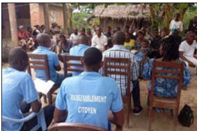
A Impfondo (Fédération RC de la Likouala)