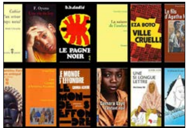
Journée internationale de l'écrivain africain