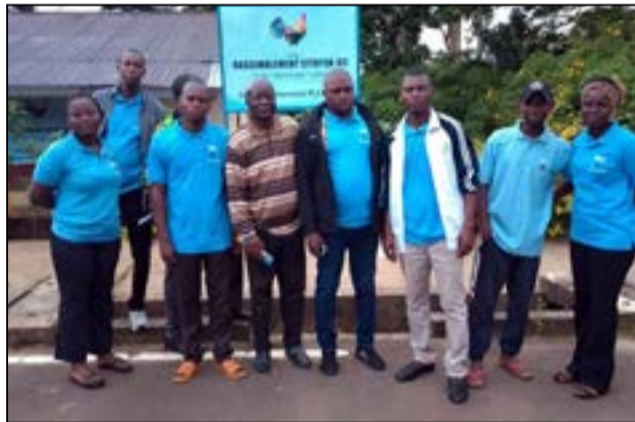
A Djambala (Fédération RC des Plateaux)