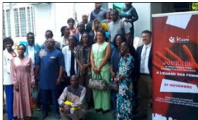
Les participants au débat sur les violences basées sur le genre

Publié à l'occasion de la journée internationale pour l'élimination des violences à l'égard des femmes, célébrée le 25 novembre de chaque année, le rapport de l'Association Kaani assistance relève que plusieurs obstacles sont à l'origine des violences faites aux femmes. Très peu de cas de violence sont enregistrés à cause, entre autres, de la peur, de la détresse et de l'isolement social des victimes. A cela s'ajoute la lenteur administrative dans la collecte des données. C'est ainsi que les violences basées sur le genre sont banalisées dans le pays. Les lois ne sont pas vulgarisées et sont donc méconnues par la population.