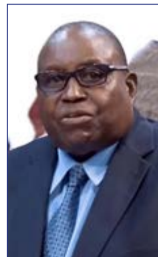
Par Dieudonné Antoine-Ganga

Le terme «société secrète» peut aussi servir à désigner d'autres organisations allant de la fraternité estudiantine aux organisations mystiques décrites dans des théories de conspiration puissantes, dotées de services financiers et politiques qui leur sont dédiés, un rayonnement mondial et parfois des croyances sataniques. Ces associations clandestines cachent leurs fins, leurs moyens, leur organisation et les noms de leurs membres au monde extérieur. Il existe aussi des sociétés secrètes qui ont prospéré tout au long de l'histoire et qui comptent, dans leurs rangs, des pères fondateurs et des membres de grandes familles royales. Les membres (le plus souvent des hommes) ont été recrutés pour rejoindre les