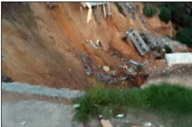
Une vue du ravin menaçant de couper la route de Mayanga.

cipalité de Brazzaville, la D.g.g.t (Délégation générale aux grands travaux) et le Ministère de l'assainissement urbain, du développement local et de l'entretien routier sont les administrations concernées par cette situation. Leurs animateurs devraient déjà se faire une idée précise de ce ravin qui ne fait qu'avancer au fur et à mesure que les pluies tombent. Aujourd'hui, la route