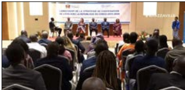
Pendant le déroulement de la cérémonie de lancement de la stratégie.

La stratégie de coopération O.m.s-Congo définit les interventions prioritaires que va mener l'O.m.s au Congo. Elle sert de référence dans la conduite des dialogues politiques, la planification biennale, la mobilisation de ressources et détermine les contributions attendues du secteur de la santé, en vue d'atteindre les O.d.d (Objectifs de développement durable) à l'horizon 2030, conformément aux priorités stratégiques énoncées dans le P.n.d (Plan national de développement sanitaire) 2023-2026, le quatorzième Programme général de travail (P.g.t) de l'O.m.s et le Plan-cadre des Nations unies pour l'aide au développement (Pnuad) relatif au Congo. Elaborée à la lumière des