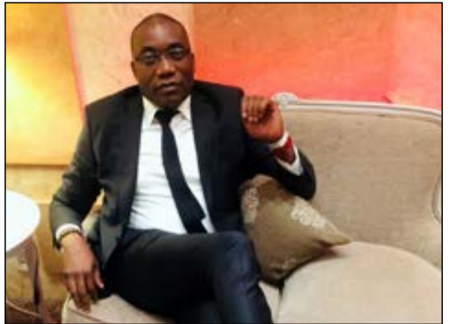
Par Charles Abel Kombo.

Le protectionnisme revient en force dans les capitales du Nord. Les États-Unis protègent leur acier et leurs technologies, la France taxe les petits colis, l'Union européenne renforce sa défense commerciale. Le tabou s'est dissipé: protéger ses intérêts économiques est redevenu légitime. Dès lors, une question s'impose: pourquoi l'Afrique, après quarante ans d'ouverture imposée, serait-elle la seule à s'interdire ce que les autres pratiquent?