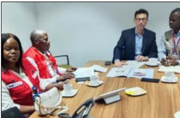
L'équipe de la C.r.c et le représentant de l'Union européenne.