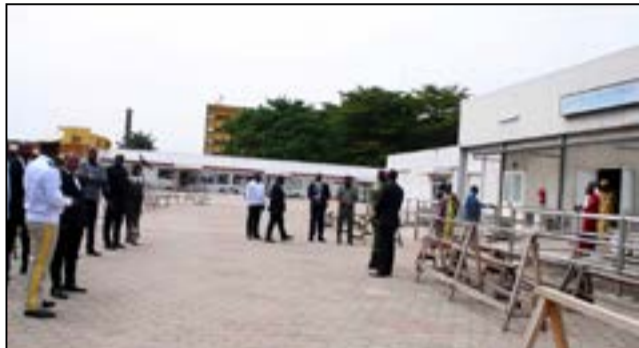
Morgue municipale de Brazzaville.

La situation sociale des travailleurs du secteur public, particulièrement ceux des institutions et structures dépendant du budget de transfert de l'Etat connaît des fortunes diverses. Si les fonctionnaires de l'Etat sont régulièrement payés, à la fin de chaque mois, les personnels dépendant des institutions et structures à budget de transfert attendent parfois jusqu'à trois voire quatre mois de suite sans être payés. Raison