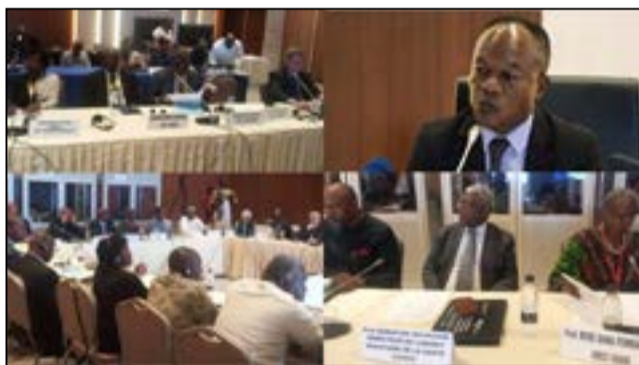
Une vue du déroulement de la réunion sur la poliomyélite.

Les flambées des poliovirus circulant continuent d'affecter le bassin du Lac Tchad et l'Angola, avec des détections récentes en Namibie. Ces évolutions soulignent la vulnérabilité de la région et la nécessité urgente de renforcer les efforts, pour atteindre une « Afrique exempte de poliomyélite ». D'où la série de résolutions qui permet-