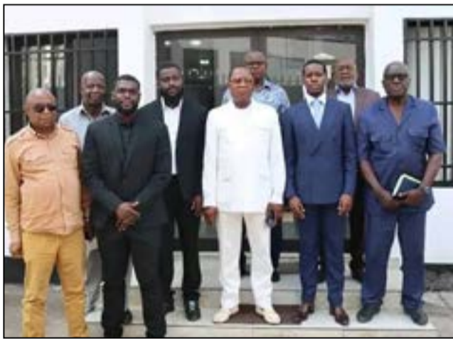
Les membres de l'association accompagnés du Comex Fecofoot

Les présidents des clubs ont apprécié cette initiative, mais ils restent sceptiques quant à sa réalisation, ayant constaté plusieurs zones d'ombre au moment où le football congolais est en crise. Ils souhaitent