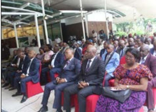
Les hauts-conseillers et les journalistes.

professionnelle et responsable de l'élection présidentielle prévue en mars 2026. Il a annoncé la relance de la campagne d'attribution de la carte de presse qui permettra aux journalistes détenteurs d'accéder aux lieux des meetings et autres événements électoraux.