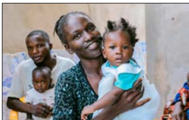
Améliorer la qualité des soins pour les mères, les nouveau-nés et les enfants.

L'Approche «Mavimpi ya mboté», lancée en République du Congo il y a trois ans, pour améliorer la qualité des soins maternels et infantiles, a franchi une étape-clé, avec la certification, le 27 novembre 2025, de 19 nouveaux C.s.i (Centres de santé intégrés). Avec des résultats probants et une mobilisation accrue des acteurs de santé, le programme appelle désormais à son extension à l'échelle nationale.