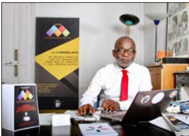
Par Chrysostome Nkoumbi Samba.

L'Afrique est à un carrefour. Elle peut reproduire ces logiques de captation ou construire un modèle fondé sur la confiance. Mais, le risque est amplifié: captation + dépendance externe = double fragilité.