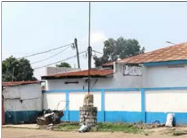
Le repère de la route des esclaves à Baongo.

Sur ce chemin, des milliers d'hommes, de femmes et d'enfants furent arrachés à leur liberté, dans le Nord des deux Congo, le Sud-Oubangui, le Sud du Congo, pour être contraints de marcher vers un destin inconnu, en direction d'abord du marché d'esclaves de Mpumbo, qui était situé à la Mairie centrale de Brazzaville, avant d'emprunter la longue piste conduisant à la côte atlantique au port de Mpinda