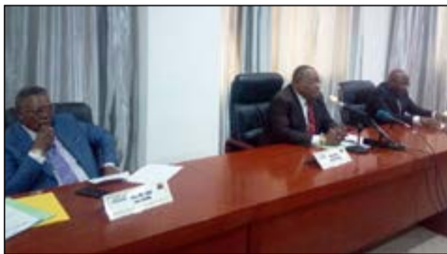
Les membres du bureau du C.s.l.c.

Le C.s.l.c souligne s'être appuyé sur un cadre juridique «robuste», notamment la loi organique révisée en 2022, qui lui confère des prérogatives en matière d'accès équitable des partis politiques aux médias audiovisuels publics. «Nous bénéficions d'un cadre juridique et institutionnel (...) garantissant l'accès équitable des partis aux médias audiovisuels publics», a-t-il poursuivi. Le rapport mentionne, également, l'adoption de «six délibérations et une directive encadrant la campagne électorale», ainsi que l'organisation des rencontres pour un dialogue avec les partis poli-