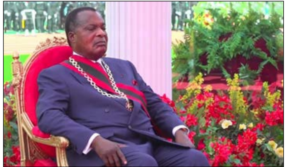
Denis Sassou-Nguesso, c'est parti pour le cinquième mandat.

S'adressant «spécifiquement à la jeunesse pour son dynamisme, son éner-