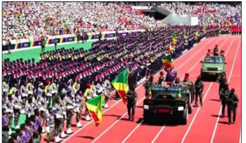
Le Président passant les troupes en revue.

C'était une cérémonie grandiose, une première dans l'histoire du Congo, qu'un Chef d'Etat fasse son entrée en fonction dans un stade plein d'un public portant différents uniformes dont certains aux couleurs nationales, alors que dehors, sous un soleil d'aplomb, il y avait encore des foules pouvant remplir une ou deux fois ce stade. La mobilisation des populations était importante, même si certaines critiques se font entendre, sur la motivation pécuniaire de cette mobilisation.