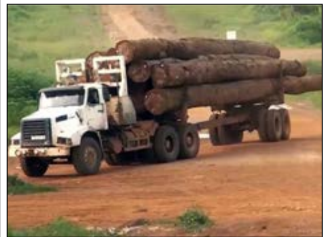
Exportation de grume.

Suivant sa politique souveraine, le Congo a simplement choisi, en 2019, faisant face à la crise financière, de faire financer certains projets de développement par des entreprises de l'industrie forestière, en contrepartie de volume bien limité d'exportation de grumes de bois. Selon la ministre de l'économie forestière, Rosalie Matondo, «le gouvernement a signé, en 2019, des conventions, avec certaines sociétés forestières, pour la réalisation des ouvrages (ponts, routes...), avec certaines sociétés forestières. Ce sont ces réalisations qui font l'objet d'exportation de grumes de bois». La Sefyd, indexée dans l'enquête de Tv5 Monde, figure sur la liste officielle des sociétés autorisées à exporter des grumes de bois.