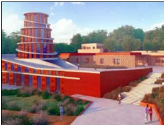
La maquette du musée de la traite négrière en construction à Loango.