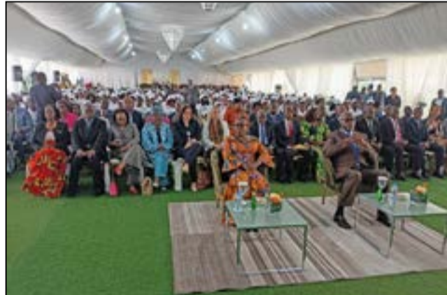
Au premier plan: Mme Jacqueline Lydia Mikolo et Hugues Ngouélondélé lors du lancement du programme.

Le Fonea (Fonds national d'appui à l'employabilité et à l'apprentissage) a lancé, lors d'une cérémonie, lundi 20 avril 2026, l'Hôtel Elbo suites, à Brazzaville, un ambitieux programme de formation en perlage de 1500 jeunes de 18-45 ans, dont 800 sélectionnés dans la ville capitale et 700 à Pointe-Noire, sous le patronage du ministre de la jeunesse et des sports, de l'éducation civique, de la formation qualifiante et de l'emploi, Hugues Ngouélondélé, en présence de la ministre des petites et moyennes entreprises et de l'artisanat, Jacqueline Lydia Mikolo, des représentants des agences du système des Nations unies, de l'Inspection générale de la jeunesse, des membres du cabinet et des jeunes.