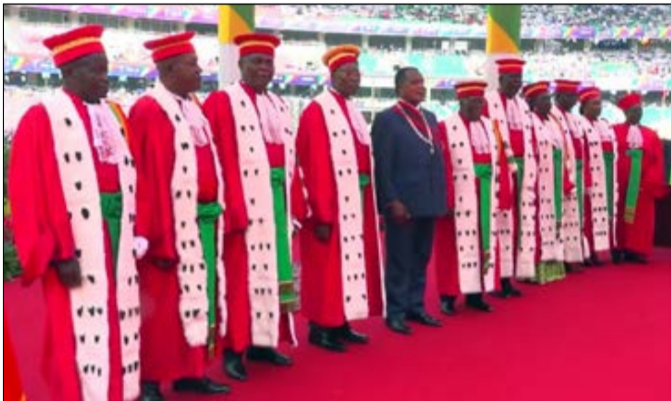
Les membres de la Cour constitutionnelle, après avoir installé le Président de la République dans ses fonctions.