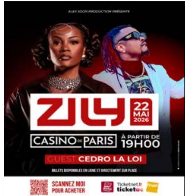
L'affiche du concert