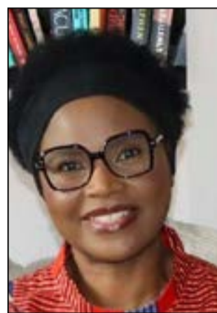
Par Lydie-Patricia Ondziet

Les valeurs ancestrales africaines constituent le socle des sociétés traditionnelles. Elles reposent sur des principes fondamentaux, tels que la solidarité, le respect des aînés, le sens du collectif et l'importance de la communauté. Ces valeurs,