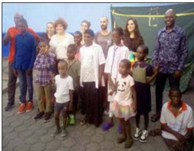
Les responsables de l'O.n.g C.p.s et les enfants de l'Orphelinat Yamba Ngai.