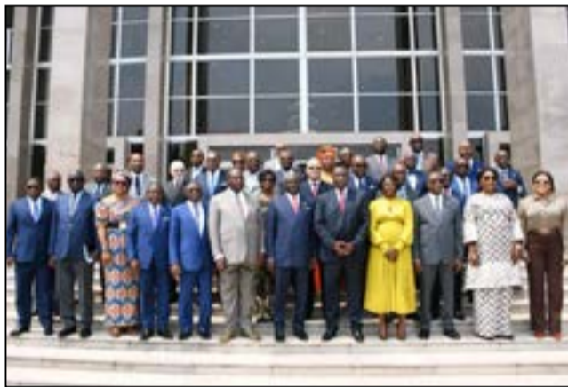
Les membres du gouvernement démissionnaire se sont réunis en conseil de cabinet.

Mais, sa mandature à la tête du gouvernement a été marquée par bien d'autres batailles politiques et économiques. Après les élections législatives de 2022, il avait présenté sa démission de principe. Le Président Denis Sassou-Nguesso lui avait alors renouvelé sa confiance, en le reconduisant. Pour relancer l'économie nationale, il lui aura fallu renouer le pays avec le F.m.i (Fonds monétaire internationale), en raison du niveau élevé de l'endettement public. Et