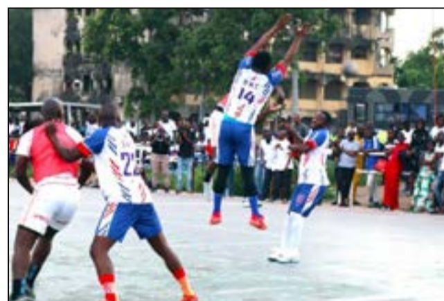
Tournoi de gala de Makélékélé.

Ministère des sports a pris de lourdes sanctions disciplinaires dont la radiation et des amendes contre