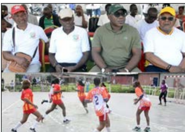
Tournoi de gala au Centre sportif de Makélékélé.

itaires d'Inter-club (39 à 31), en seniors dames; - l'Asoc a étrié l'Académie par 42 à 13, en seniors hommes. Pour les dirigeants des clubs, ce tournoi est une aubaine, parce qu'il permet de mettre les équipes en jambes, afin de corriger les faiblesses constatées. En effet, le handball congolais traverse une crise qui se manifeste, entre autres, par la rareté des compétitions. Cette crise remonte au non-respect de la décision de la C.c.a.s (Chambre de conciliation et d'arbitrage du sport), concernant les élections à la Fécohand (Fédération congolaise de handball). La nouvelle