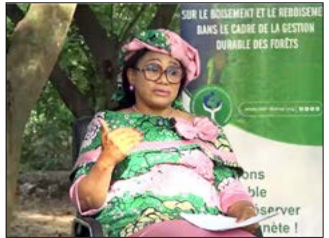
Rosalie Matondo, ministre de l'économie forestière.

L'enquête réalisée par deux journalistes de Tv5 Monde et diffusée au début du mois d'avril 2026 a suscité une certaine indignation sur l'exportation des grumes de bois, alors que depuis le 1er janvier 2023, l'exportation des grumes de bois est officiellement interdite au Congo-Brazzaville, conformément à la loi n°33-2020 du 8 juillet 2020 portant code forestier. L'enquête pointe du doigt une société, la Sefyd (Société d'exploitation forestière Yuan Dong Congo), une entreprise de droit congolais, opérant notamment dans le Département de la Sangha, qui serait passée «maître dans l'exportation illégale de grume de bois». Mais, du côté du gouvernement, le ton est formel: «Il n'y a pas d'exportation illégale de bois ou de grumes de bois par des entreprises d'exploitation, de transformation et de commercialisation de bois».