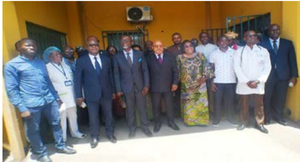
Photo de famille après l'inauguration de l'unité de néonatalogie de l'Hôpital de référence de Baongo.

vice de néonatalogie à l'Hôpital spécialisé Mère-enfant Blanche Gomès, «pour son appui technique», ainsi que l'A.c.p.g.b (Association congolaise des professionnels du génie biomédical), «pour son accompagnement dans la remise en état du matériel existant et dans le choix de l'installation des équi-