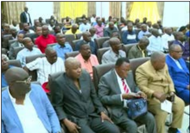
Une vue des participants à la réunion sur le football congolais.

Le ministre en charge des sports, Hugues Ngouélondélé, avait appelé à la tenue d'une grande réunion, vendredi 10 avril 2026, à son cabinet, à Brazzaville, regroupant les membres du Comité exécutif de la Fécofoot, les cadres de son cabinet, de la Direction générale des sports, les responsables des clubs de football féminin et masculin des Liges 1 et 2, les présidents des commissions finances, éthique et arbitrage. Il s'avère que le Comité exécutif de la Fécofoot a renoncé à participer à cette réunion dont il ne connaissait pas l'ordre du jour et par respect des principes régissant la fédération. Le ministre Ngouélondélé a regretté cette attitude et les a appelés à la responsabilité, car «ensemble, nous devrions ouvrir une nouvelle page, une page de réforme, de transparence et de reconstruction» du football congolais.