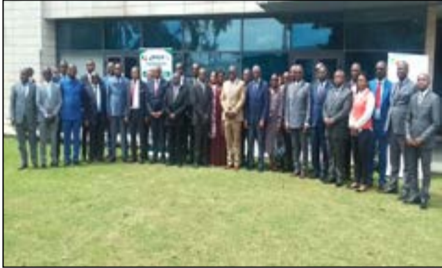
Les organisateurs et les participants à la fin de la cérémonie d'ouverture

La session est intervenue après l'obtention le 9 avril 2026, du financement additionnel de 30 millions de dollars américains, soit 15 milliards de francs Cfa, accordés au Pagir par la Banque mondiale, partenaire financier du projet, pour consolider les acquis et amplifier l'impact du programme, en vue de poursuivre les réformes structurelles. Celles-ci visent à renforcer la mobilisation des ressources publiques, à améliorer la qualité de la dépense publique, renforcer la gouvernance des entreprises publiques, la gestion de la dette et de la trésorerie et à promouvoir une gouvernance transparente et responsable, notamment dans les secteurs prioritaires que sont la santé et l'éducation. Au cours de sa session, les membres du Comité de pilotage ont procédé à l'analyse d'une série de dossiers, notamment le rapport d'exécution du Pagir exercice 2025, avec le volet axé sur les ré-