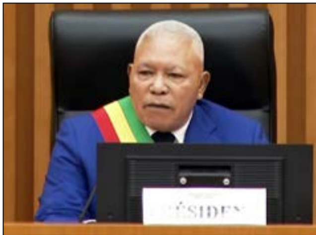
Isidore Mvouba, président de l'assemblée nationale.

Et de conclure «que cette belle messe a connu son épilogue et son aboutissement dès le premier tour, sous la forme d'un tsunami électoral qui a consacré la brillante victoire de l'enfant d'Edou. Nous pouvons répéter à l'envie que cette victoire est celle du peuple congolais dans toute sa diversité. «Vox populi, vox Dei»; ce que le peuple veut, Dieu le veut», a-t-il déclaré, en félicitant le «peuple congolais qui a accompli, les 12 et 15 mars