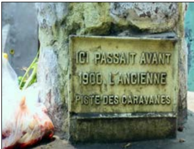
Un repère indiquant la piste des esclaves à Baongo.

de l'actuelle Angola dès le 16ème siècle et plus tard au port de Loango dans l'actuel Congo, à partir du 17ème siècle. Ils étaient ensuite embarqués de force vers Sao Tomé qui était une escale obligatoire, où certains esclaves étaient débarqués pour être utilisés dans les champs de canne à sucre, de café et de cacao et pour l'avitaillement des navires en transit, acheminant les autres esclaves aux Amériques.