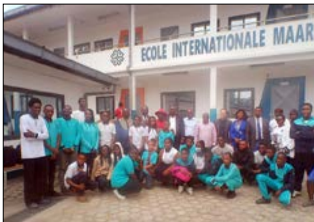
Elèves, enseignants et responsables de l'École internationale Maarif turco-congolaise.

L'exposition a également mis en lumière des créations d'une grande valeur symbolique et esthétique, comme le raphia, notamment le Let-sulu (carré de raphia), des masques emblématiques tels