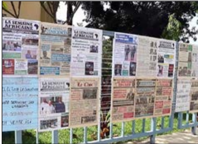
Des journaux en vente à Brazzaville, il y a quelques années. Aujourd'hui, la presse imprimée tend à disparaître, au profit de la presse en ligne.

Notre pays a progressé à la 68 ème place sur 180 pays, gagnant ainsi trois places par rapport au classement de 2025 où il occupait la 71 ème place. Des efforts restent à déployer pour avancer, d'autant plus que R.s.f pointe le fait que « l'influence du pouvoir se ressent fortement sur le