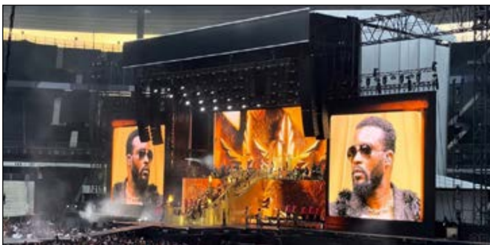
Fally Ipupa, un double Stade de France historique.

Le chanteur congolais (RD Congo) a rassemblé près de 65 mille fans à chaque concert, autour d'un spectacle mêlant rumba, afrobeat et sonorités urbaines. Il a offert un spectacle de grande envergure, salué pour son énergie et sa qualité artistique, confirmant son positionnement parmi les figures incontournables de la musique africaine contemporaine. L'Ambassade de son pays en France a rendu hommage à Fally Ipupa, en le qualifiant d'ambassadeur culturel dont le parcours contribue au rayonnement de la RD Congo à l'international.