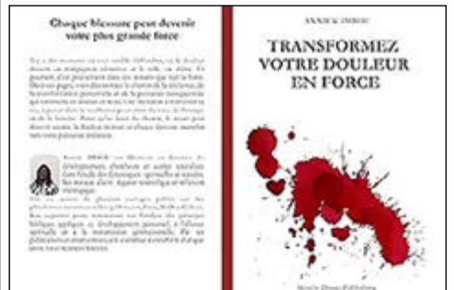
La couverture du livre d'Annick Imbou

Puisque vous vous êtes accommodés à cet endroit, vos habitudes sont devenues une seconde nature. Il est difficile de partir, car vous craignez de blesser, mais il s'agit de votre destinée. Chercher à plaire aux hommes plutôt qu'à Dieu conduit beaucoup à passer à côté de leur destinée. Beaucoup se réveillent dix ans plus tard en disant: «Si j'avais su...».