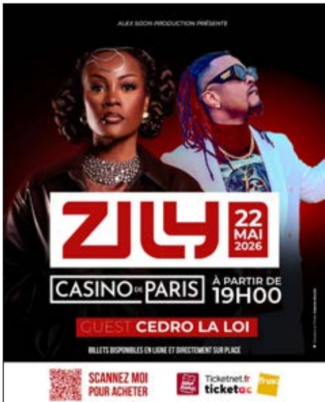
L'affiche du concert

Couronnée de succès, l'expérience voit ses échos voyager, loin, jusqu'au cœur de la métropole: Paris. C'est cette ville lumière qui lui ouvre de nouveaux horizons. Opportunément, elle va taper à l'œil du dynamique label Alexsoon Production, qui s'éprendra de son talent, au point de la présenter en concert. Celui-ci est programmé le