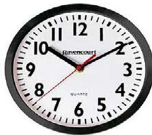
Une horloge indiquant l'heure pour maîtriser le temps.

La notion du temps doit être de rigueur à cause du retard que nous avons accumulé depuis longtemps. Cela permet de hâter le processus de développement. Les anglo-saxons que l'on considère, de par le monde, comme étant les maîtres de l'art du pragmatisme, disent avec leur flegme habituel, dans la langue de Shakespeare, s'agissant de l'utilisation du temps, « Time is money » (Le temps, c'est de l'argent). Et tout le monde le comprend bien.