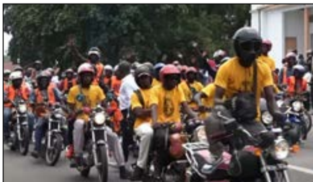
Les taximotos se sont illustrés au défilé de la fête du travail à Pointe-Noire.

patronage d'Elault Bello Bellard, président de la C.s.t.c (Confédération syndicales des travailleurs du Congo), qui a fait un discours dans lequel il a parlé de lutte syndicale, des menaces que subissent les syndicalistes, etc. Les travail-