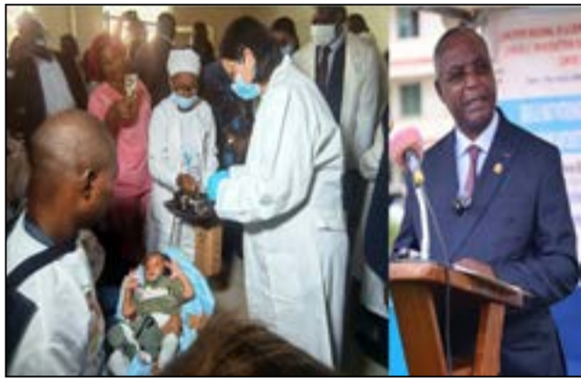
A droite, le ministre Ibara, lors du lancement de la semaine africaine de vaccination.

En attendant que le P.e.v (Programme élargi de vaccination) ne publie les statistiques relatives à la 16 ème édition de la S.a.v (nombre de nouveau-nés vaccinés, par localité, les équipes déployées), on peut dire qu'avec la réalisation de cette campagne, le Congo améliore ses efforts dans la couverture vaccinale qui se situe au-delà des 80%. Comme l'a souligné le Dr Vincent Dossou Sodjinou, représentant-résident de l'O.m.s au Congo, lors de la cérémonie de lancement de la S.a.v, le Ministère de la santé et de la population doit intégrer pleinement la vaccination dans les soins de santé primaires et assurer un accès équitable aux vaccins. Les professionnels de santé doivent continuer à être les premiers ambassadeurs de la confiance vaccinale dans les communautés, alors que