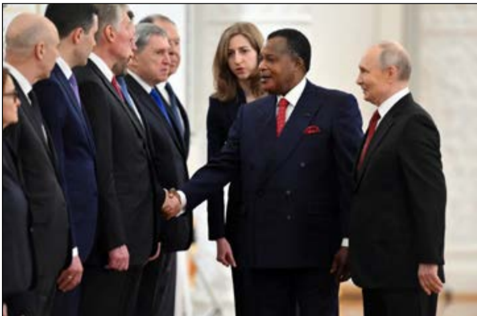
Le Président Sassou-Nguesso saluant les officiels russes.

Accompagné d'une délégation gouvernementale composée de cinq ministres, notamment, Constant Serge Bounda (Affaires étrangères), Raymond Zéphirin Mboulou (Défense nationale), Denis Christel Sassou-Nguesso (Coopération internationale), Paul Valentin Ngobo (agriculture), Urbain Fiacre Opo (mine). Sa journée du mercredi 29 avril a commencé par le dépôt d'une gerbe de fleurs, au monument du soldat inconnu. Puis, c'était la séance de travail avec son homologue russe, Vladimir V. Poutine. Parmi les projets prioritaires de coopération