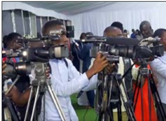
Une presse libre et responsable est un facteur de stabilité sociale et de paix.

férents messages prononcés à l'occasion de cette journée, la conférence est l'occasion, pour les responsables de ces organisations et les journalistes, de faire le point sur l'état de la liberté de la presse au Congo et de mettre l'accent sur les conditions de travail des journalistes, en appelant à la concrétisation de l'aide publique aux médias, à travers le Fonds d'appui aux organes de presse, mis en place par le gouvernement depuis la loi des finances 2025, en remplacement de la Rav (Redevance audiovisuelle) qui, depuis son institution en 2001, n'a jamais pu être concrétisée en faveur de tous les médias.