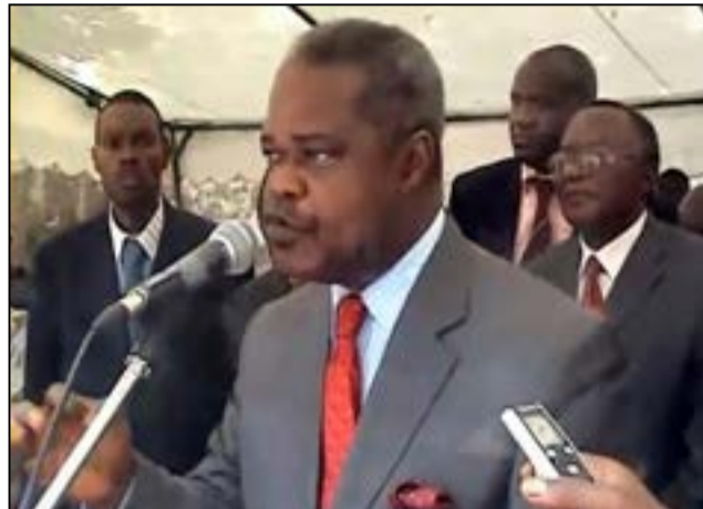
L'ancien Premier ministre Ange-Edouard Pongui.

Ange-Edouard Pongui regagne le Congo en novembre 2006, à la faveur de la politique d'ouverture prônée par le Président Sassou-Nguesso. Les 27 et 28 décembre 2006, il participe au premier congrès extraordinaire de l'U.pa.d.s, à Brazzaville, qui fait de lui vice-président du parti. Le Conseil national, qui se réunit du 30 novembre au 1er décembre 2008, le choisit comme candidat de l'U.pa.d.s à l'élection présidentielle de juillet 2009. Mais, sa candidature est recalée par la Cour constitu-