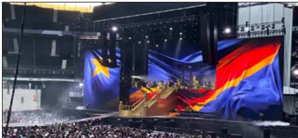
Le podium au Stade de France.