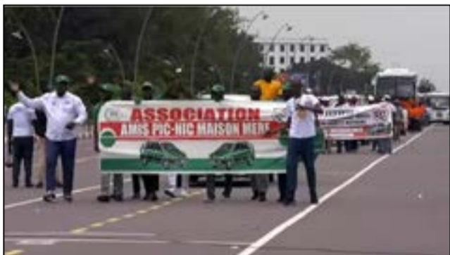
Une vue du défilé sur le Boulevard Alfred Raoul

Vendredi 1er mai 2026, c'était la fête du travail, connue comme la journée internationale des travailleurs, célébrant les conquêtes sociales en faveur des travailleurs. A l'époque du monopartisme dans le pays (1963-1990), c'était l'affaire du parti au pouvoir, à travers son syndicat unique. Avec l'instauration du multipartisme et de la démocratie, c'est l'affaire des organisations syndicales. Celles-ci ont eu du mal à reprendre le flambeau de la célébration de la fête du travail.