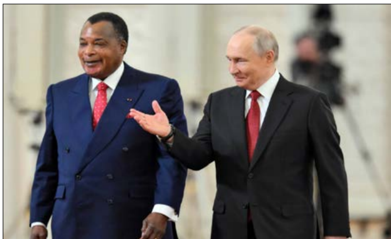
Les Présidents Sassou-Nguesso et Vladimir Poutine