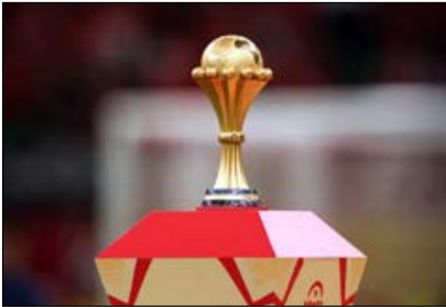
Coupe d'Afrique des Nations de football sénior.

À l'issue du tour préliminaire, le chemin vers la phase finale se poursuivra, avec le tirage au sort des éliminatoires, prévu le 19 mai 2026. Au total, 48 équipes, y compris les trois