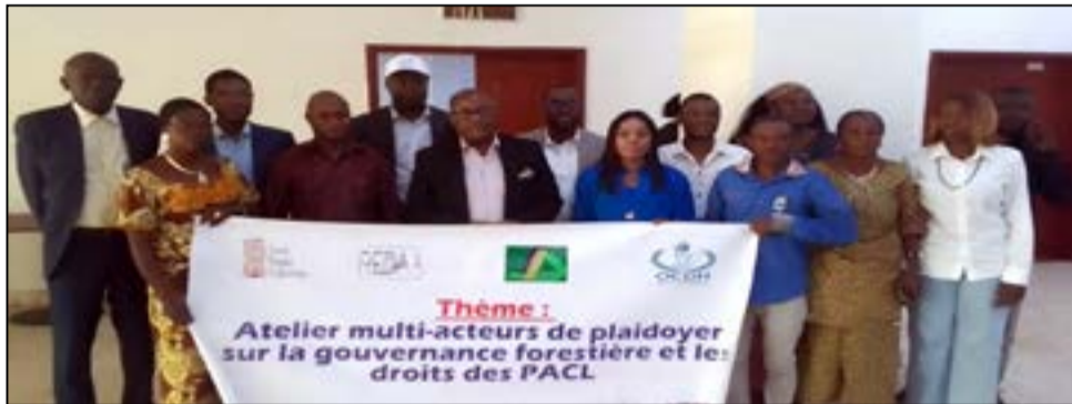
Les responsables et les participants à la fin de l'atelier.

Organisé avec l'appui technique de l'O.n.g internationale F.p.p, «Forest peoples programme» (Programme des peuples forestiers), et le soutien financier du Programme Redaa mis en place par le gouvernement britannique, l'atelier de l'O.c.d.h a permis d'analyser les résultats issus d'une mission effectuée auprès des populations autochtones et des communautés locales. Le but étant de recueillir les contributions des participants à l'atelier et de formuler les recommandations concrètes à l'attention des autorités publiques, pour la prise en compte des droits des populations autochtones et des communautés locales dans le partage des bénéfices et les obligations des sociétés forestières. Cela répond à la mise en œuvre du Projet «promouvoir la reconnaissance et la mise en œuvre des droits des peuples autochtones, afin d'améliorer la gouvernance des terres et des ressources naturelles et d'enrayer la dégradation de l'environnement au Congo et en RD Congo». Ouvert et clôturé par Aubin Djondo-Kendé, directeur des mécanismes de consultation et de la coopération à la Direction générale de la promo-