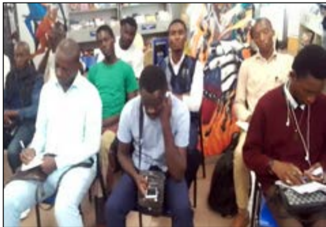
Une vue des participants.

En philosophie, la vérité n'est qu'un idéal, puisqu'elle n'est jamais trouvée, on ne l'atteint jamais, elle s'inscrit toujours dans l'horizon. Le philosophe allemand Nietzsche qualifie les chercheurs de la vérité de tristes chevaliers de la triste figure. Pour lui, on ne peut en au-