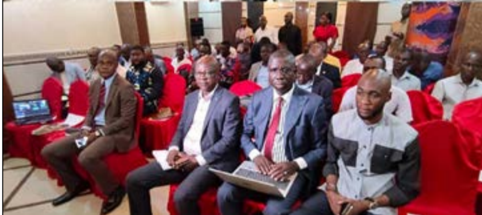
Conférence de presse du R.f.c.